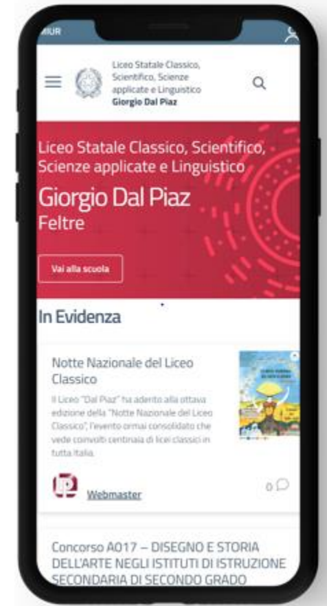
Un esempio di sito web che rispecchia i requisiti del bando